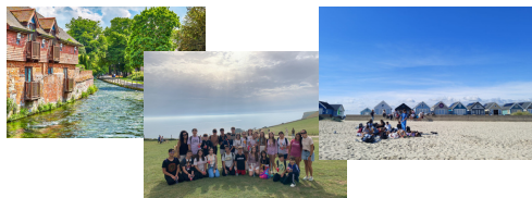
Viajes de medio día a Winchester, Jurassic Coast y Southbourne.