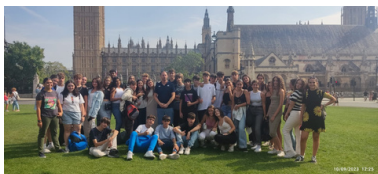
Viaje día completo a Londres y Oxford