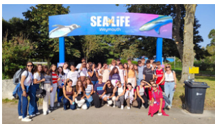
Acuario de Weymouth. Sea Life.

Durante la estancia de los estudiantes, se harán múltiples actividades en su tiempo libre. Estas, comenzarán después del almuerzo, sobre las 13.00-13.30. Dependiendo de la actividad, podrán ir a pie o en un bus ya organizado. Las actividades pueden variar en función del clima. Entre todas las excursiones destacamos: