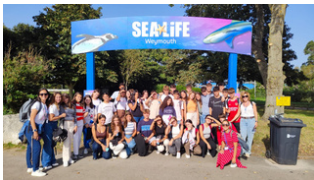
Acuario de Weymouth. Sea Life.

Durante la estancia de los estudiantes, se harán múltiples actividades en su tiempo libre. Estas, comenzarán después del almuerzo, sobre las 13.00-13.30. Dependiendo de la actividad, podrán ir a pie o en un bus ya organizado. Las actividades pueden variar en función del clima. Entre todas las excursiones destacamos: