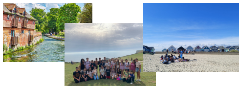
Viajes de medio día a Winchester, Jurassic Coast y Southbourne.